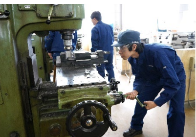
機械類【機械加工科/機械制御科】