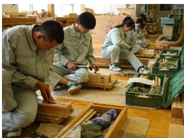
建設環境類【建築科/環境工学科】