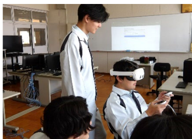
電気情報類【電気科/情報技術科】